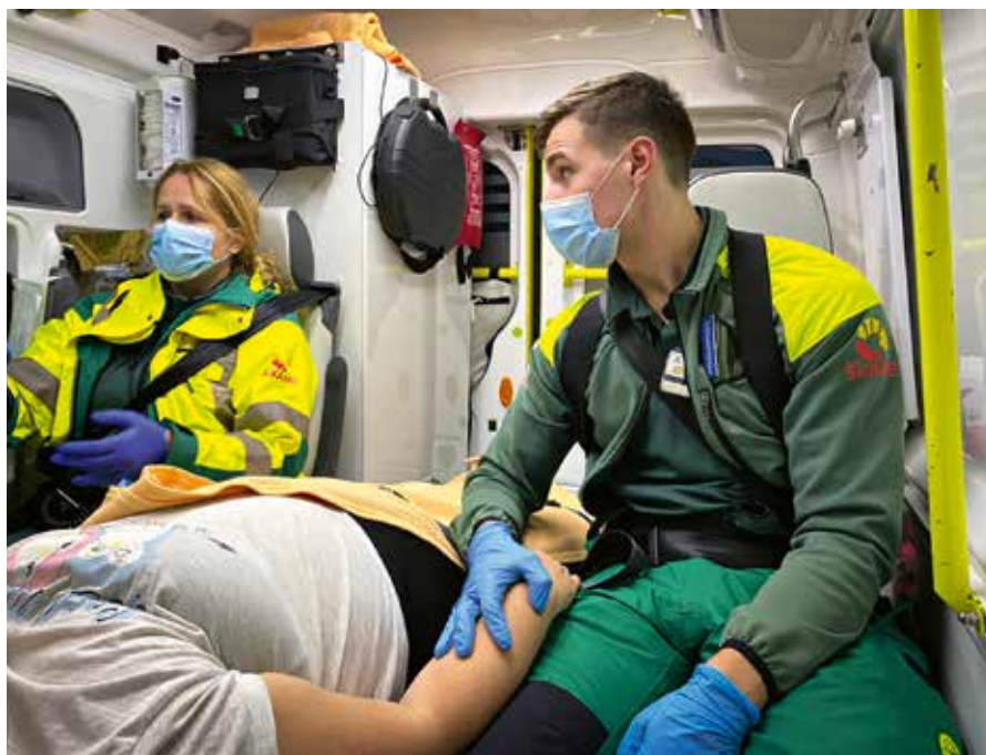
Bråttom till akuten.

PERSONLIGHET SPELAR STOR ROLL i yrket. Hög stresströskel, ett inre lugn och social kompetens är egenskaper som är avgörande inom ambulanssjukvården. Det är viktigt att kunna ställa om snabbt – ena stunden kan det vara lugnt, men så händer plötsligt något och då måste man agera. Inte minst måste man kunna hantera oroliga anhöriga.