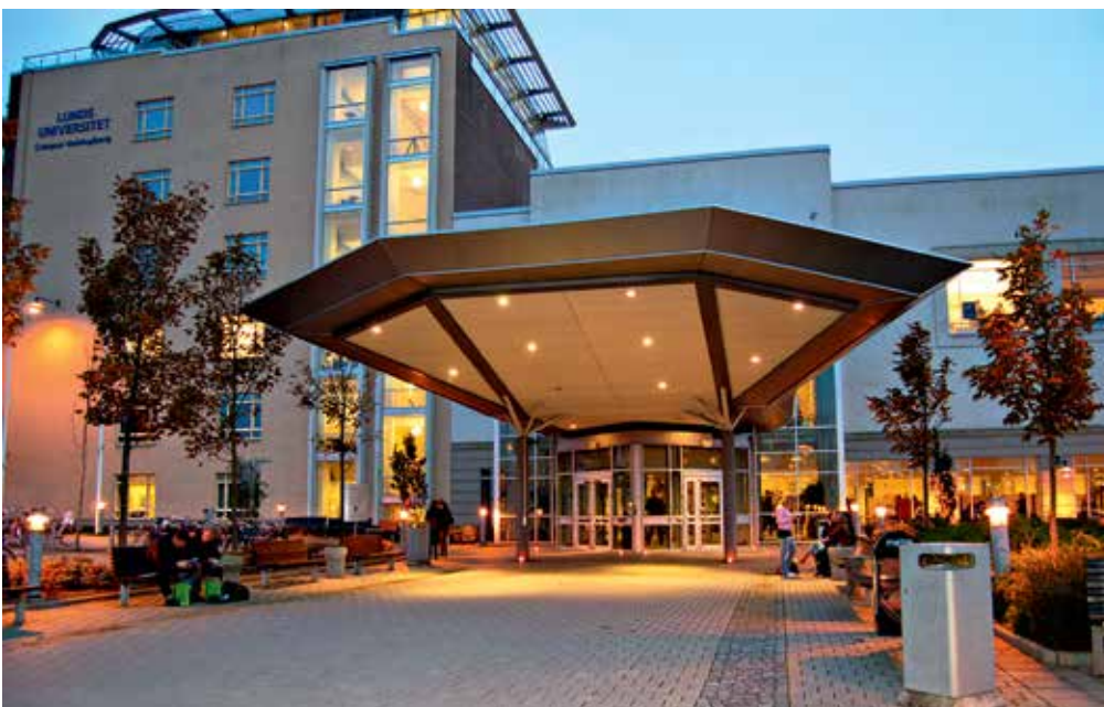
Den gamla Tretornfabriken byggdes om när Campus Helsingborg skulle flytta in och fick bland annat en tydlig entré.