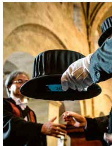
”Hattfakulteterna” får en egen promotionsdag nästa år.

Svarsfrekvensen på enkäten var 34 procent bland anställda och av dem uppgav var fjärde kvinna att hon har utsatts för sexuella trakasserier någon gång under sin anställning. För män är siffran 7 procent. 17 procent av kvinnorna och drygt 4 procent av männen uppger att de har varit utsatta under de senaste tre åren.